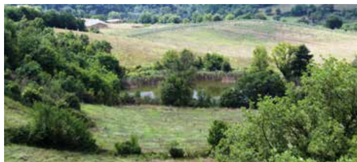
Il laghetto "di Barbini" e l'edicola a Sant'Anna

Walter Malagoli walter.malagoli@hotmail.it