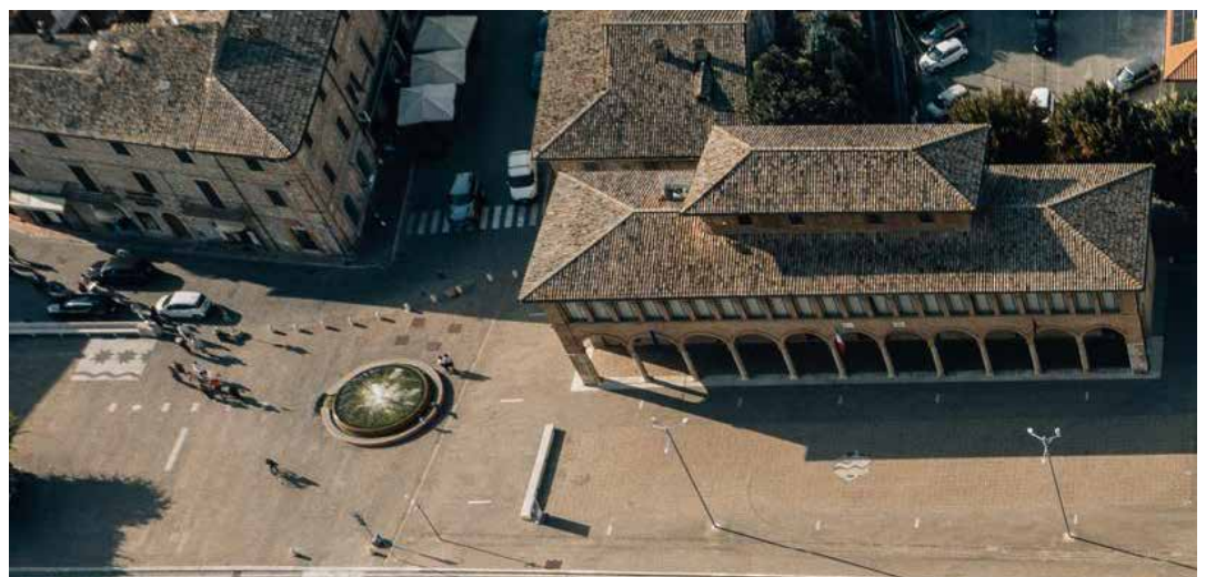
La piazza: spazio con un'ampia pavimentazione in pietra di Santafiora, lavorata alla fiamma

travertino ai mattoni, che richiamano le strutture degli edifici circostanti, con alcuni inserti simbolici (cielo, terra, acqua), riportati sul pavimento ed ispirati a quelli ritrovati di recente sul tetto dell'antica chiesina della Porziuncola. Nel suo cuore una grande preziosa fontana circolare composta da venti elementi in monoblocco di marmo Rosso di Verona, "quinte" di verde e pergolati, le tradizionali "banchette" riqualificate creano un'atmosfera di funzionalità armoniosa, resa suggestiva da una illumina-