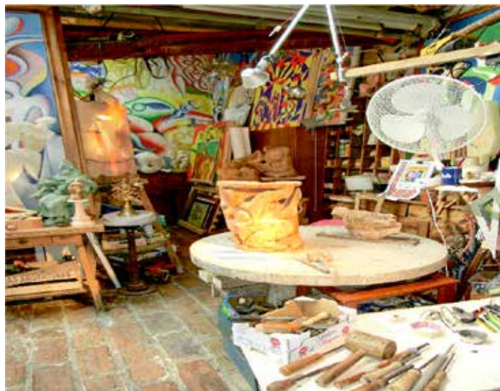
Laboratorio museo