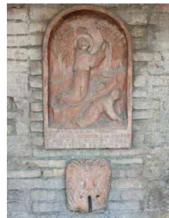
Fontanella di San Giorgio Assisi, corso Mazzini. Autore Francesco Prospero

parte proprio dal basso. Associazioni, gruppi di cittadini, studenti, imprenditori locali possono presentare progetti di riuso, potrebbero dialogare con le amministrazioni, coinvolgere i residenti. Restituire dignità a un luogo in disuso diventa così un atto concreto di cittadinanza attiva. Lo abbiamo visto di recente anche a San Vitale, quando la città è scesa in piazza per puntare l'attenzione sulla "piazza che non c'è": l'amore spesso non si racconta, ma si dimostra. Ogni gesto conta. E ogni spazio recuperato o ogni luogo attrezzato per la comunità è un pezzo di bellezza restituita a tutti. È questo per me uno dei messaggi più importanti che Francesco ha voluto donarci.