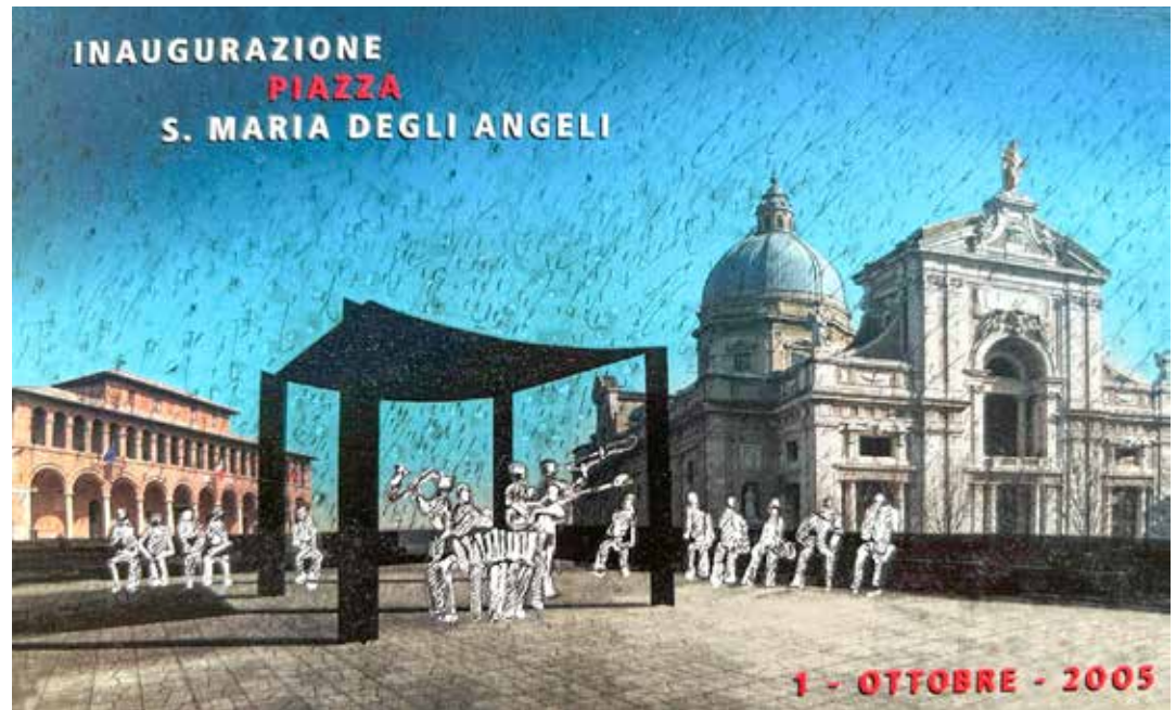
La cartolina pubblicata in occasione dell'evento. Disegno dell'architetto Bruno Signorini