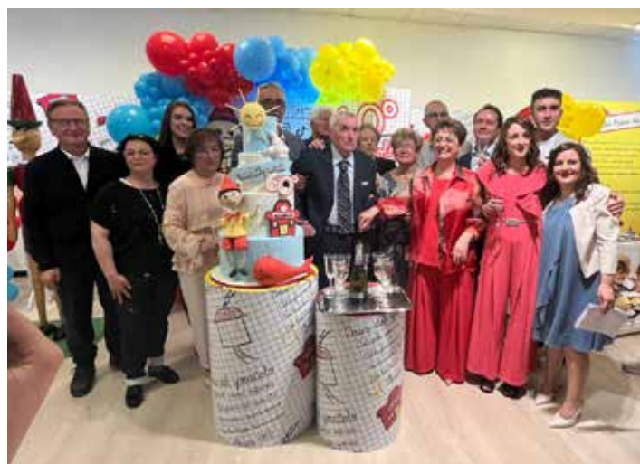
Gruppo di famiglia per i 60 anni della Casa del Giocattolo

seguito iniziai, sempre nel settore dell'elettricità, a svolgere la mansione di rappresentante e con la mia auto, una Bianchina, percorrevo le contrade di Umbria e Marche”.