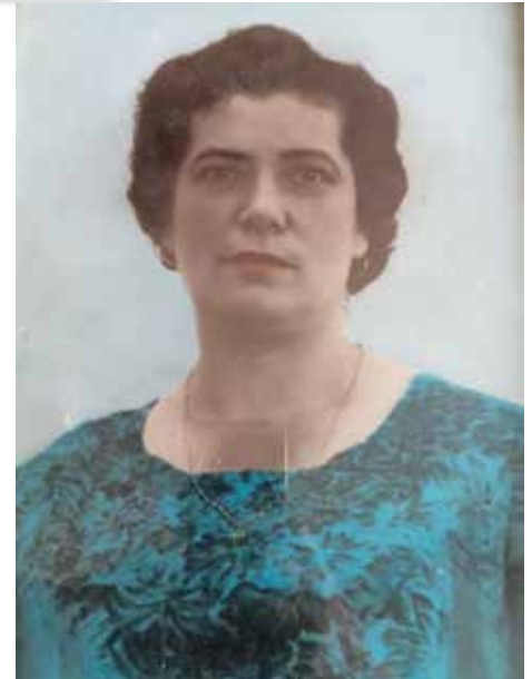
La postina, Villetta Ciotti