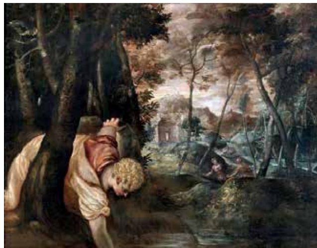
Nello specchio di Narciso.