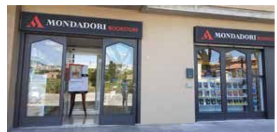
Nuovo punto vendita Libreria Mondadori in via Los Angeles, 17 - Santa Maria degli Angeli

“L'inaugurazione della nuova nostra Mondadori Bookstore di Santa Maria degli Angeli è stata una giornata indimenticabile, piena di sorrisi, emozioni e... tantissimi libri! Un grazie speciale va a tutti voi che siete passati a trovarci, clienti affezionati e nuovi amici, che avete condiviso con noi questo momento importante. La vostra presenza, i vostri acquisti, i bellissimi fiori che ci avete regalato e le vostre parole piene d'affetto hanno reso questa festa ancora più bella. La nostra libreria oggi è più grande, luminosa, accogliente e, soprattutto, piena di libri e voglia di condividere cultura. Ma senza di voi, nulla di tutto questo avrebbe lo stesso significato. Vi aspettiamo, ogni giorno, per continuare insieme questo viaggio meraviglioso tra le pagine. Con gratitudine. Il team della Mondadori Bookstore di Santa Maria degli Angeli”