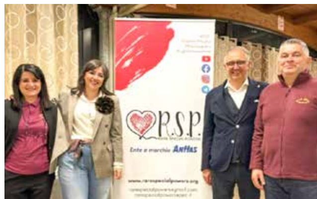
Il ricavato della vendita dei libri è stato devoluto dall'autore alla Associazione di Malattie Rare