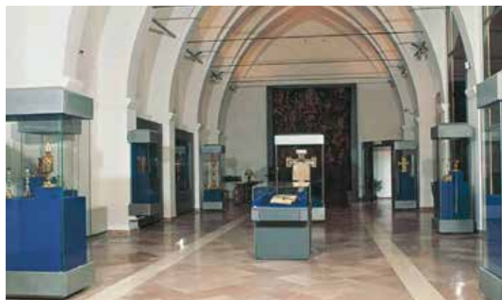
Il Museo del Tesoro, che espone un'importante raccolta di arte medioevale, acquisi nel 1955 una parte importante delle opere che appartenevano a Perkins

sua collezione. Che invece lasciò ai frati francescani di Assisi: una sorta di restitutio in pristinum . Una cinquantina di tavole del Trecento e Quattrocento della Collezione Perkins sono esposte oggi al Museo del Tesoro, allestito all'interno del Palazzo Papale, a cui si accede attraverso l'abside della Basilica inferiore di San Francesco. I dipinti sono esposti in parte alla Galleria Nazionale dell'Umbria e in parte, 33 opere, al Museo Diocesano di San Rufino. Per chi volesse portargli un fiore, Perkins è sepolto nel cimitero di Assisi.