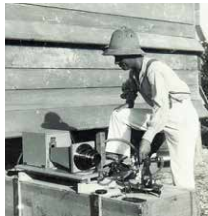
A destra: il sestante

meno celeste: un'inezia, rispetto agli spazi siderali. Una corrispondenza da Chisimaio dell'agenzia Stefani, che il Corriere della Sera riporta il 16 gennaio 1926 sotto il titolo "L'eclissi solare felicemente osservata dalla missione italiana nell'Oltre Giuba", informa gli italiani sull'esito della spedizione: "La missione inviata dal Governo italiano per l'osservazione dell'eclissi totale di sole attesa per questa mattina alle 8, ha potuto esplicare il compito ad