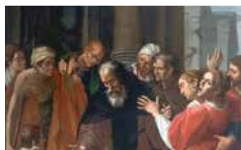
Servizio pag. 6-7