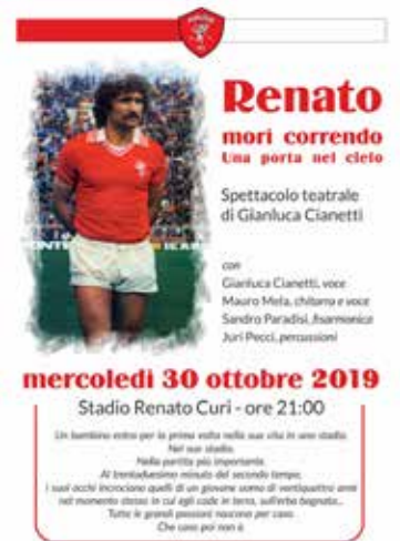
Locandina dello spettacolo su Renato Curi

"Raccogliere, in una prossima pubblicazione, tutti i miei scritti (racconti e poesie); una sorta di opera omnia. Tra i miei programmi ho anche il desiderio di salire ancora su qualche palcoscenico per comunicare al mondo le mie emozioni e cercare di trasferirle nell'anima di chi è disposto a riceverle. La vittoria che un essere umano può avere è quella di risollevarsi dopo aver toccato il fondo, ricominciando a vivere emozionandosi ed emozionando gli altri".