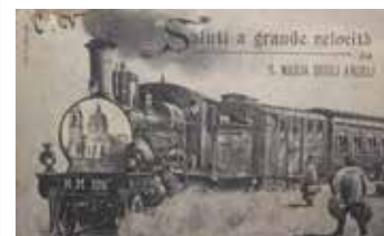
Servizio pag. 23