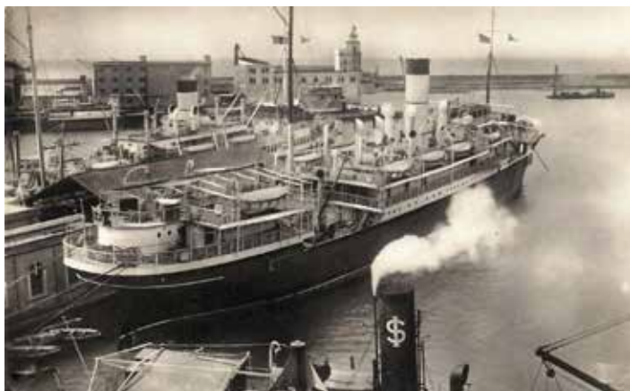
A sinistra: Il piroscopo Firenze, dove trovarono imbarco i componenti della missione astrofisica, destinazione Chisimaio, Oltregiuba.